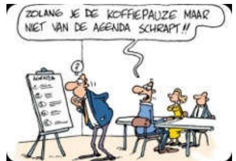
Uit blad AMBO

In een aantal gevallen is geadviseerd een kleinere tuin te nemen.