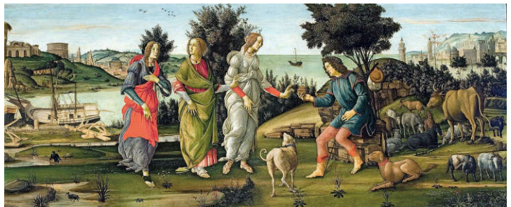
Oordeel van Paris met geklede godinnen | Bron: Sandro Botticelli Galleria Cini