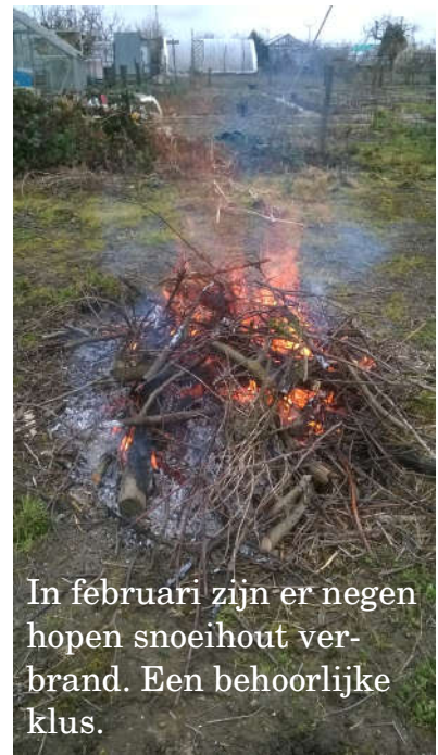
In februari zijn er negen hopen snoeihout verbrand. Een behoorlijke klus.